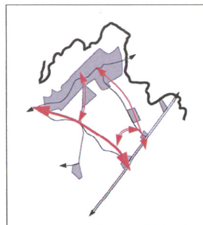
Principe schématique : densification du réseau de liaisons douces

De plus, le chemin de tour de village constitue un élément fort de l'identité paysagère du Thuit Anger. C'est pourquoi il est décidé d'utiliser ce principe, de le valoriser pour en faire le principe de structuration pour la croissance du village : le chemin de tour de village sera recréé en limite entre les secteurs de développement et le secteur agricole ou naturel.